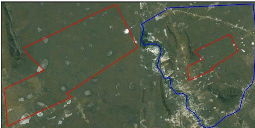
Figura 6 - Parcela correspondente à parte de um imóvel em condomínio