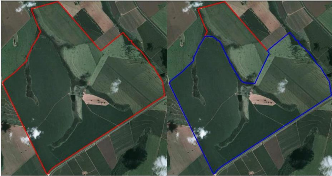
Figura 4 - Parcela certificada extrapola o imóvel objeto do título de domínio

viii. Parcela certificada não contempla parte do imóvel objeto do título de domínio;