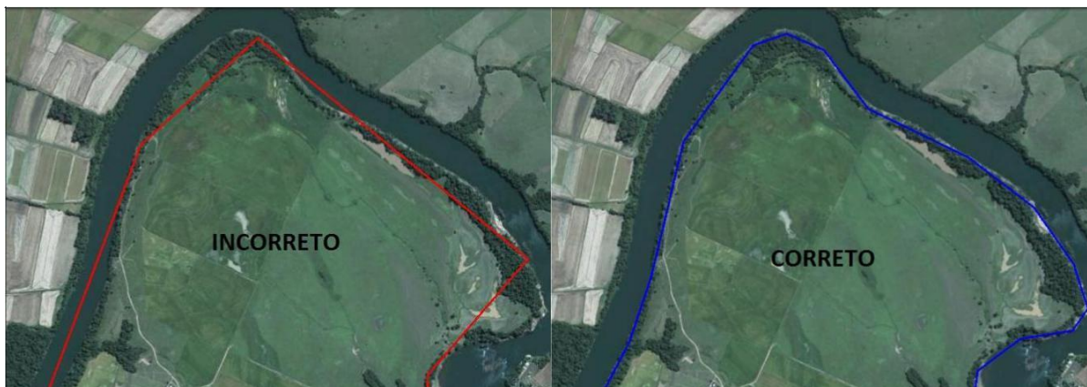
Figura 1 - Representação de limites sinuosos