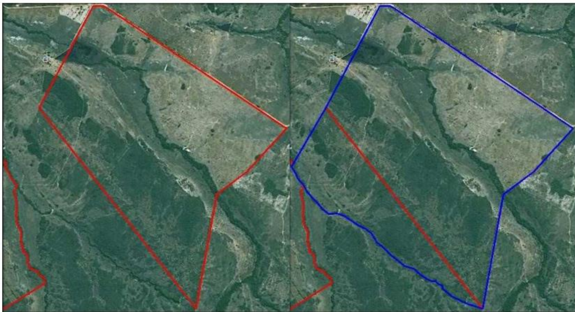
Figura 5 - Parcela certificada não contempla parte do imóvel objeto do título de domínio

viii. Parcela certificada não contempla parte do imóvel objeto do título de domínio;