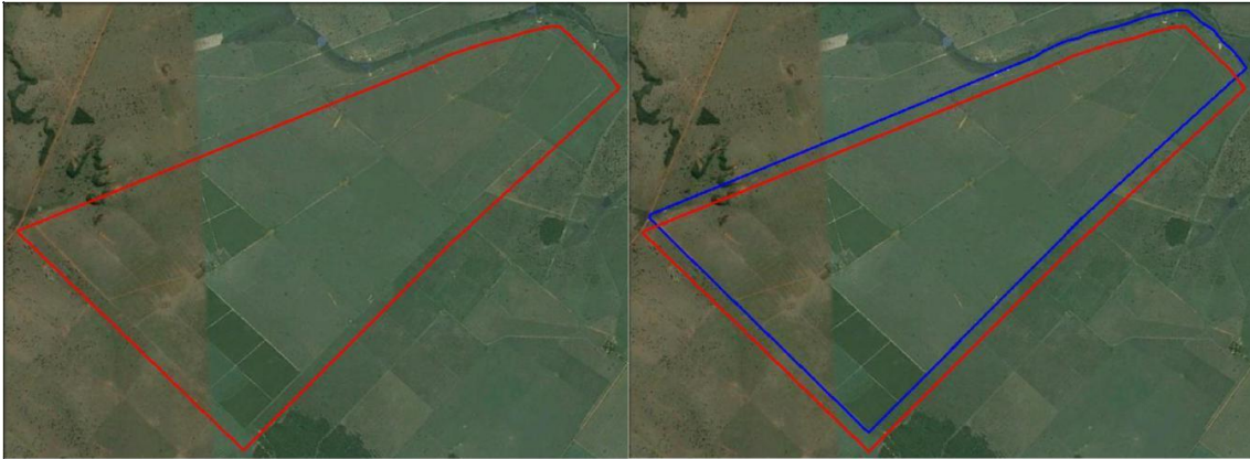
Figura 2 - Parcela deslocada em relação ao imóvel objeto do título de domínio